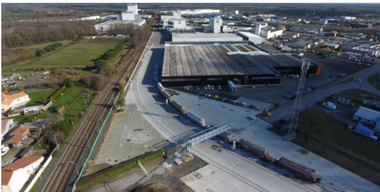
Installation terminale embranchée de PRB, d'où partent près de 70 000 tonnes de marchandises par an

En France, l'enjeu est de doubler la part du fret ferroviaire dans le transport terrestre de marchandises d'ici 2030 (passage de 9 % à 18 %). En 2020, le montant des investissements réalisés sur le réseau ferré en Pays de la Loire, a été le plus élevé des régions françaises, hors Ile-de-France,. En effet, près de 380 millions d'euros ont été investis sur le réseau, hors maintenance, pour assurer la modernisation et la performance du réseau. C'est 75 % de plus qu'en 2019 (214 millions d'euros).