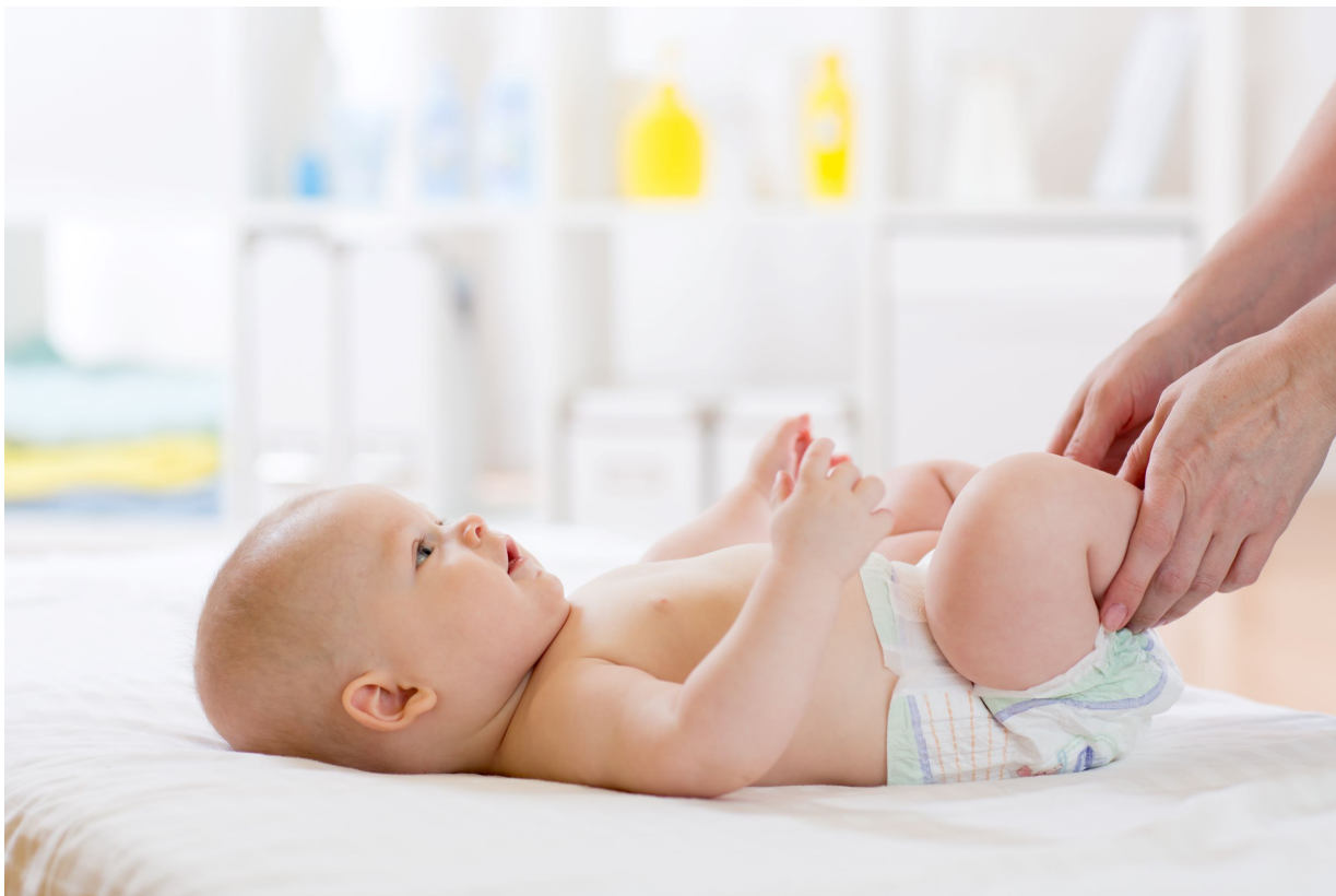
Exemple: fixations auto-agrippantes pour couches culottes