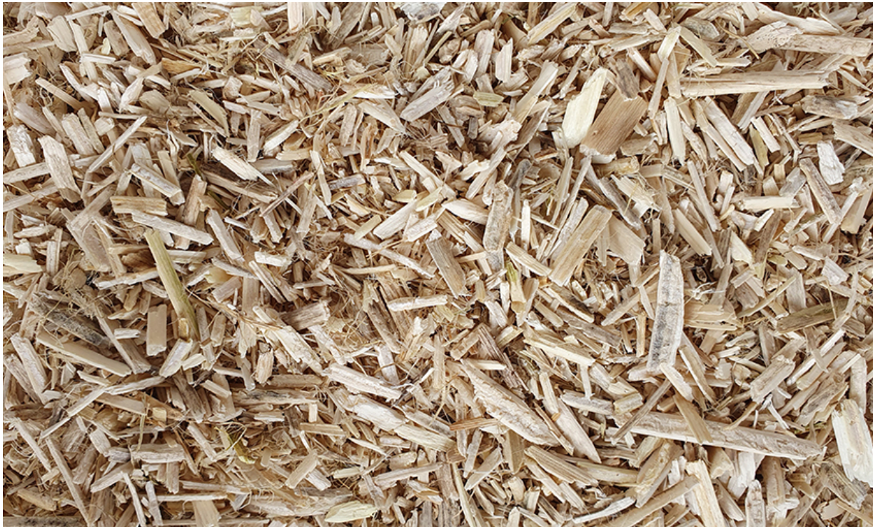
Paille de chanvre

Ressources émergentes, l'utilisation des matériaux biosourcés dans la construction se déploie sur le territoire ligérien, résultat d'une prise de conscience environnementale. En effet, la tendance à vouloir construire avec des matériaux durables, écologiques et de proximité se fait de plus en plus sentir comme en témoigne la présence de salariés dans tous les départements ligériens.