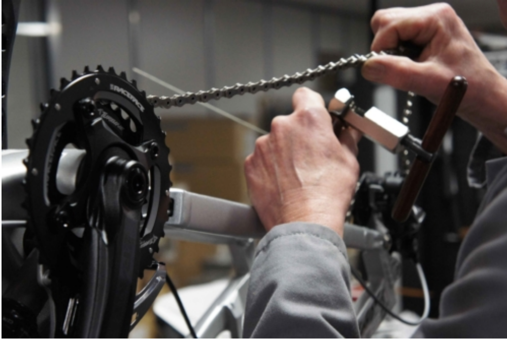
© MFC – Manufacture Française du Cycle