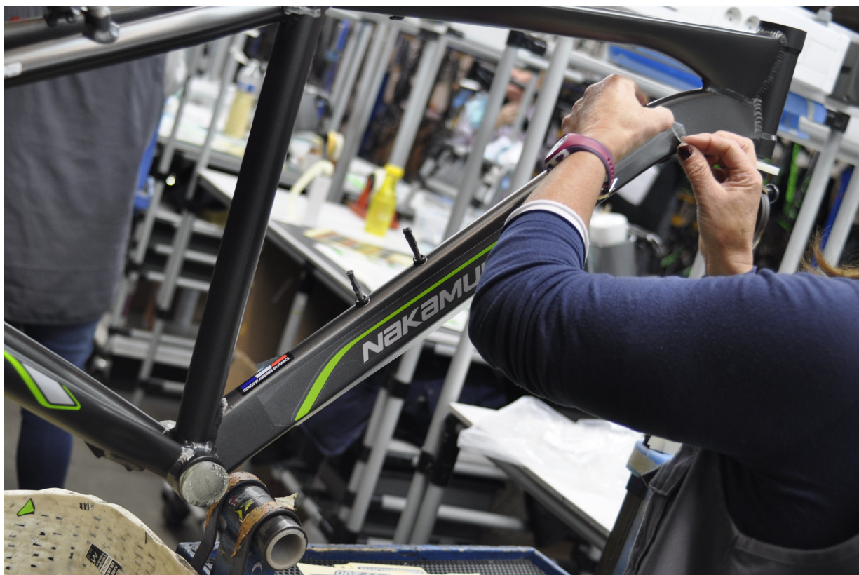
Pose de stickers sur un cadre de vélo