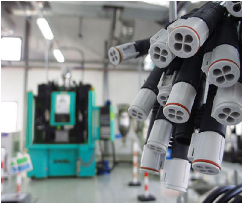
• Connecteurs SOURIAU