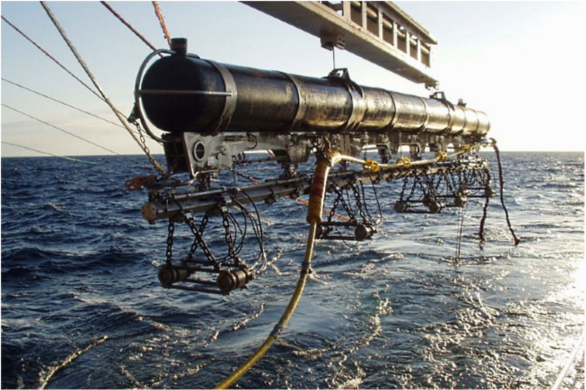
• Systèmes de transmission de données sous-marins pour le génie océanographique (© SERCEL)