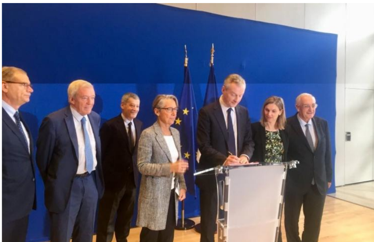
Signature du contrat de filière des industriels de la mer

(sources : GICAN, Observatoire de la métallurgie)