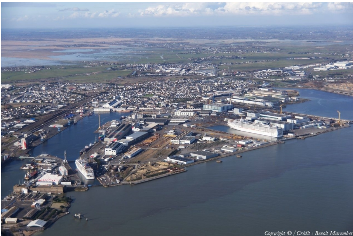
Vue aérienne du port de Saint-Nazaire