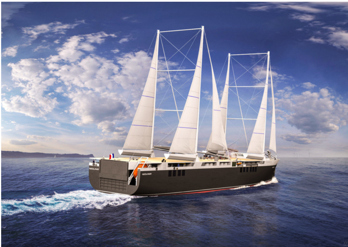
Projet du NEOLINER, un cargo à propulsion principale vélique