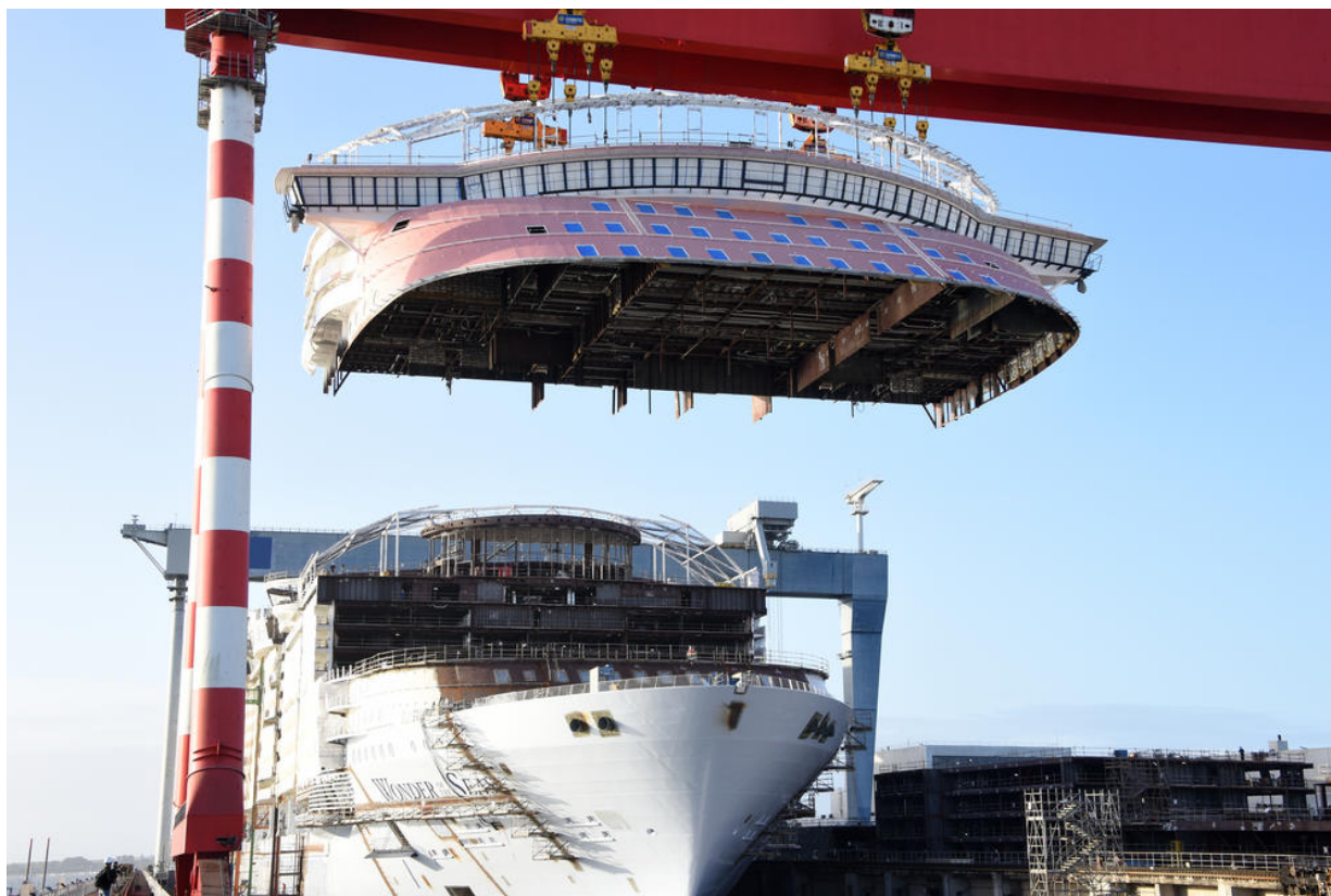
Construction aux Chantiers de l'Atlantique du Wonder Of The Seas, plus grand paquebot de croisière au monde

Les Chantiers de l'Atlantique (Saint-Nazaire – environ 3 000 employés) sont le plus grand chantier naval de France et d'Europe. Dotés d'un outil industriel de pointe où se construisent navires civils et militaire, ils proposent des prestations allant de la construction à la maintenance. Constructeur des deux plus grands paquebots de croisière en activité du monde, seuls les Chantiers de l'Atlantique ont les infrastructures adaptées pour fabriquer ce type de navires en France. Les Chantiers se positionnent également de plus en plus sur les énergies marines et dans les constructions offshore.