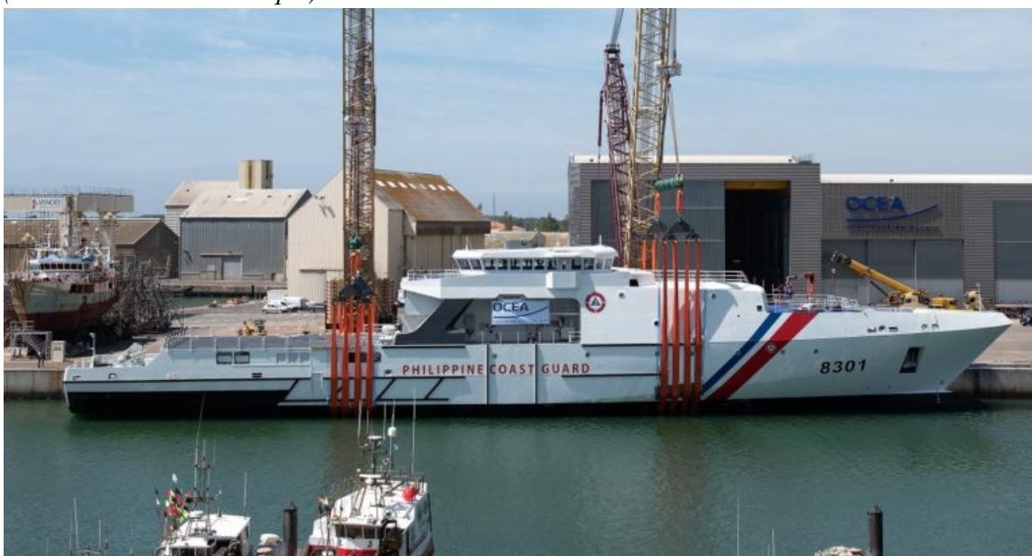
• Lancement par OCEA de l'OPV 270 , plus grand navire de patrouille offshore (OPV) en aluminium au monde