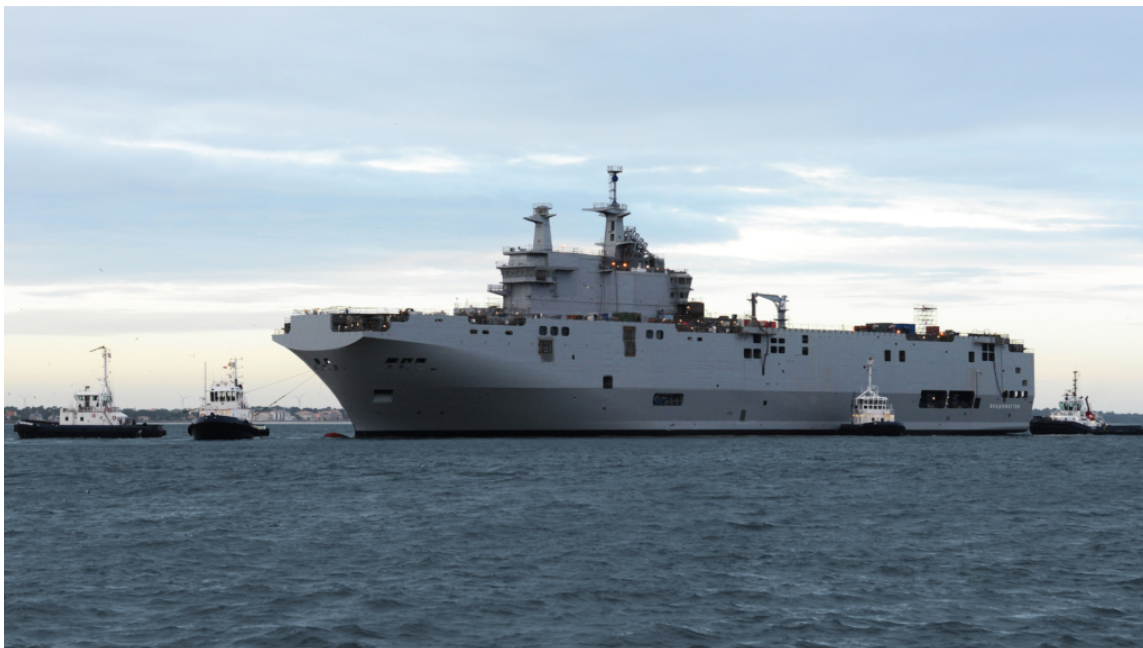
• Classe BPC Mistral, développé en partenariat avec les Chantiers de l'Atlantique et Naval Group (© Chantiers de l'Atlantique)